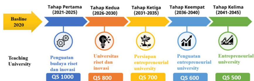
Gambar 1. RPJP UNP tahun 2021-2045 (Sumber: Dokumen Renstra UNP 2020-2024)

Capaian dan Kemajuan yang telah dicapai UNP seiring dan sejalan dengan RPJP PTN BH UNP 2021-2045 dengan Goalnya menjadi Entrepreneurial University , sebagaimana terlihat pada Gambar 1.